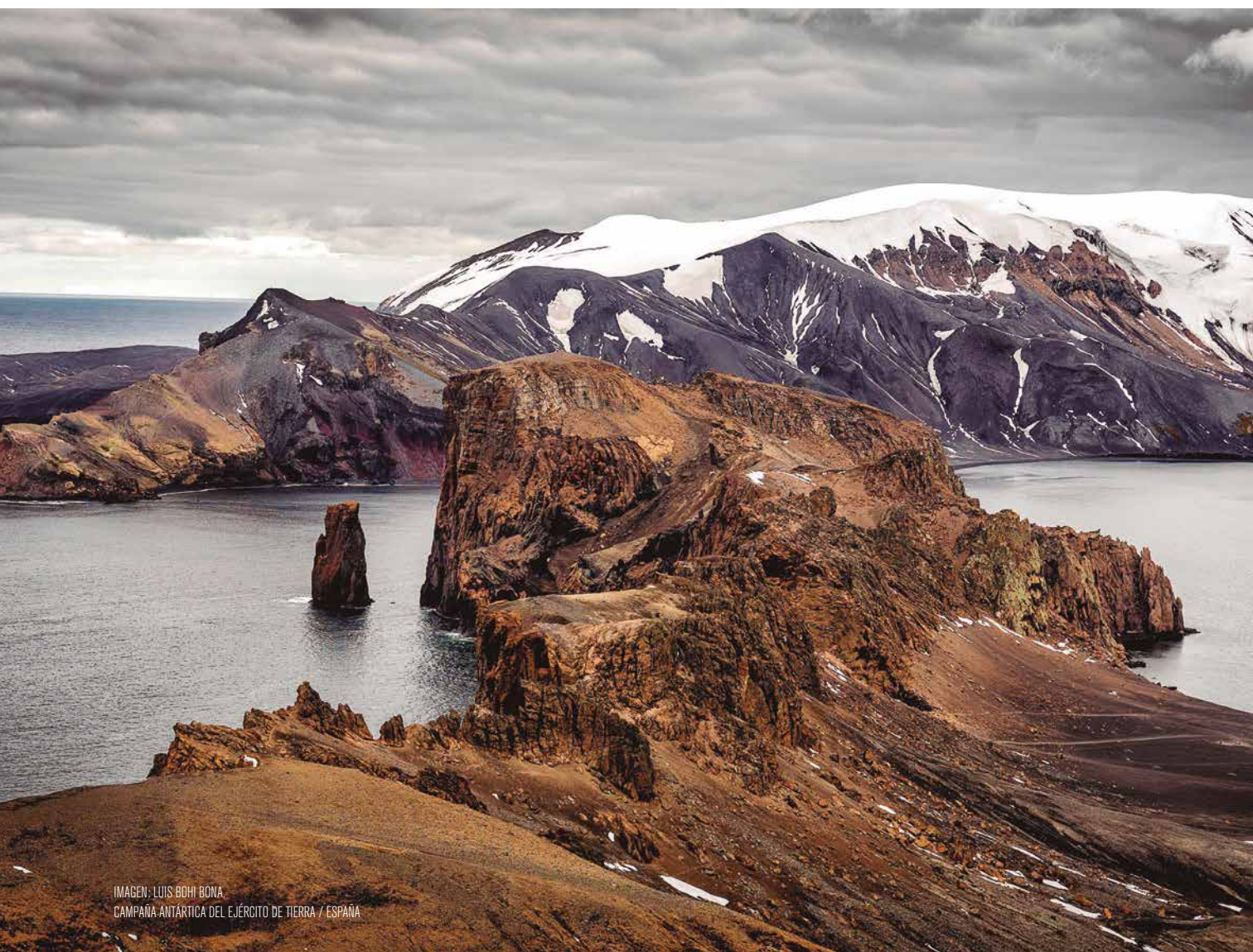
CAMPAÑA ANTÁRTICA DEL EJÉRCITO DE TIERRA / ESPAÑA