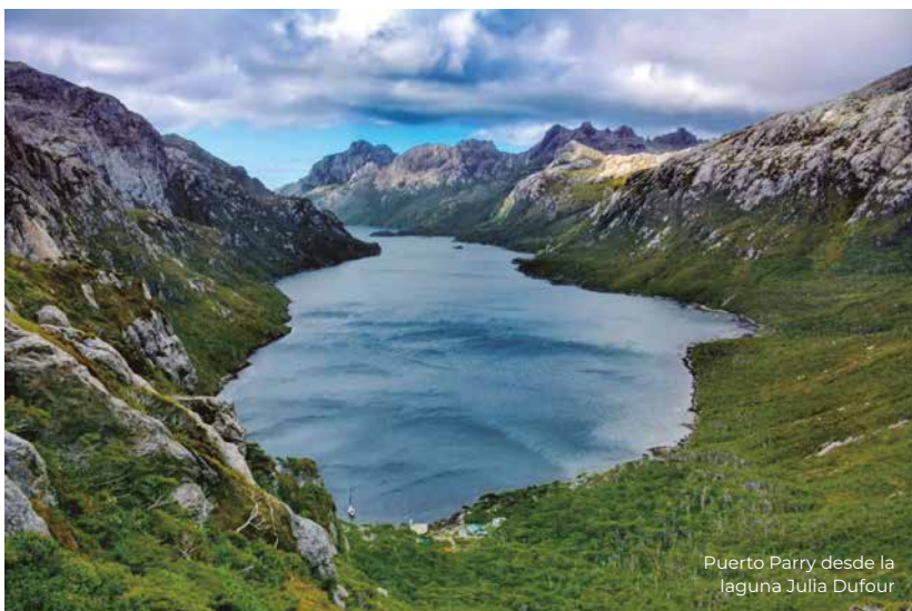
Puerto Parry desde la laguna Julia Dufour

Después de Piedra Buena, la historia se aceleró. En 1884 la Escuadra Expedicionaria al Sur, al mando del Comodoro Augusto Lasserre, construyó el faro de San Juan de Salvamento (el primer faro argentino) y también un presidio. Desde aquellos años, la Armada Argentina se encargó de que la Isla de los Estados se fuera incorporando a la narrativa nacional, cuyo único escenario entonces era la pampa infinita y donde el sur no existía ni se enseñaba el mar en las aulas. Ese relato épico fue construido por miles de marinos anónimos que exploraron la isla, balizaron sus aguas y escribieron las mejores páginas de nuestro sur.