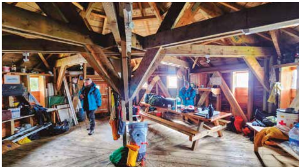
Interior del Faro del Fin del Mundo que ahora es un refugio