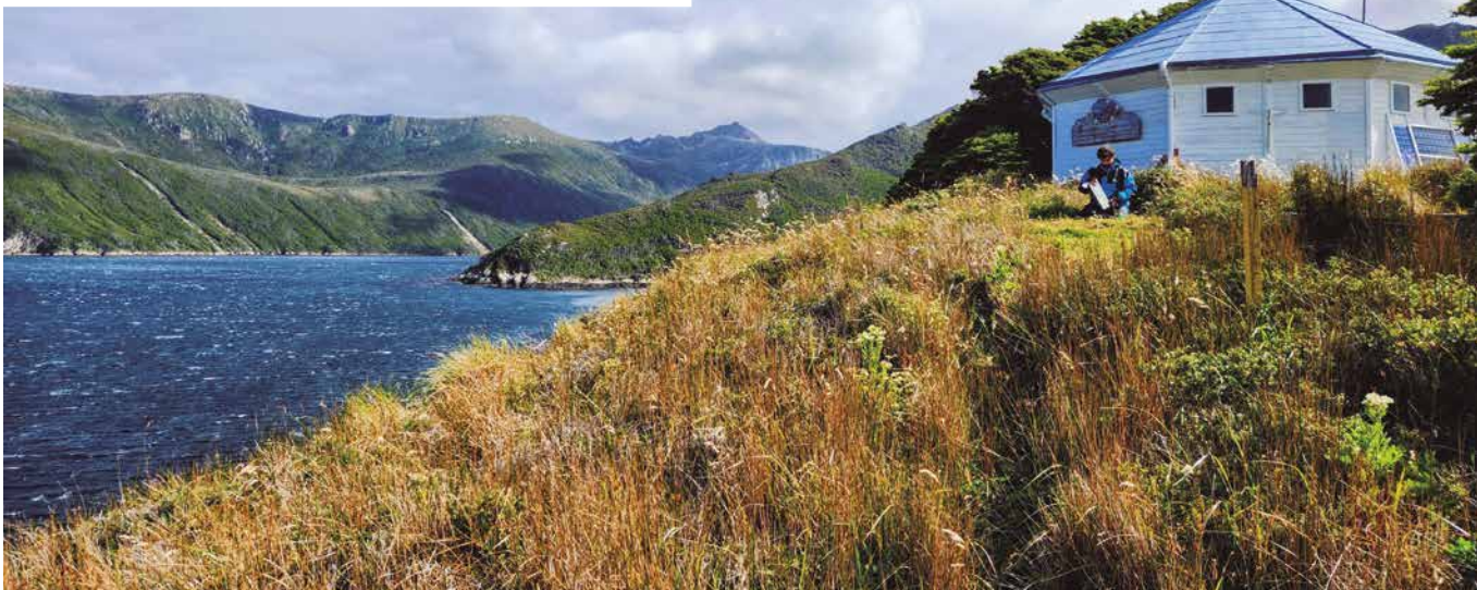
Faro de San Juan de Salvamento