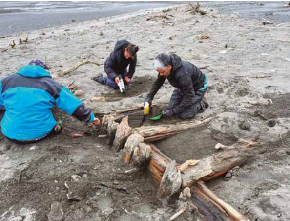
Equipo de arqueólogos trabajando en los presuntos restos del naufragio de la Espora

con habilidades distintas y un ideario compartido. Ese fue el desafío. Buscamos en los muelles y en los claustros, en los talleres de arte y en los bares, en la ciudad y en el campo, en los clubes náuticos y en las redes. Casi sin darnos cuenta nos congregamos. La voluntad y el azar (que suelen colaborar en secreto) fueron reuniendo a una comunidad de marinos, arqueólogos y artistas que no se conocían, pero que compartían una pasión, que nos convirtió en amigos, y un objetivo, que nos transformó en equipo. Dos capitanes, seis tripulantes, cuatro arqueólogos, una artista plástica, un fotógrafo naturista y un médico (y eximio cocinero, cuyo hijo fue el tripulante más joven de la expedición) se sumaron a la partida, sin más contrato ni honorarios que ser parte del equipo. Muchos más nos apoyaron y alentaron desde tierra, entre ellos el querido Centro Naval y la Sociedad Militar Seguro de Vida, y, como siempre, los buenos amigos de la vida.