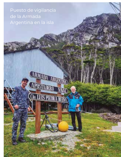
Puesto de vigilancia de la Armada Argentina en la isla