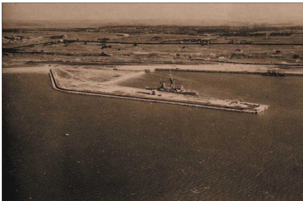
Base Naval Mar del Plata en 1938, con el Buque Base Gral. Belgrano amarrado.

argentinas que participaron del famoso Abrazo del Estrecho en febrero de 1899, entre los Presidentes Federico Errázuriz, de Chile, y Julio A. Roca. Dados los servicios a los cuales era destinado, y como consecuencia de haber perdido la capacidad de propulsión, fue reclasificado como Buque Base . Toda la actividad que se desarrollaba en una base naval tenía lugar en el viejo Belgrano , incluyendo la Escuela de Submarinos. Cuando en 1947 se habilitaron los primeros edificios de alojamiento en la base, ya no fueron necesarios sus servicios y entonces es radiado por decreto N° 12.502 de ese año (25) .